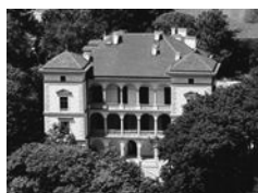
Villa Decius Palace Seat of the Association

Personalities such as the President of PEN International John Ralston Saul, a Norwegian anthropologist Fredrik Barth, an American intellectual Paul Berman, a Spanish philosopher Josep Ramoneda, a French political scientist Dominique Moisi, British historians Timothy Garton Ash and Norman Davies, delivered speeches at the Villa Decius conferences.